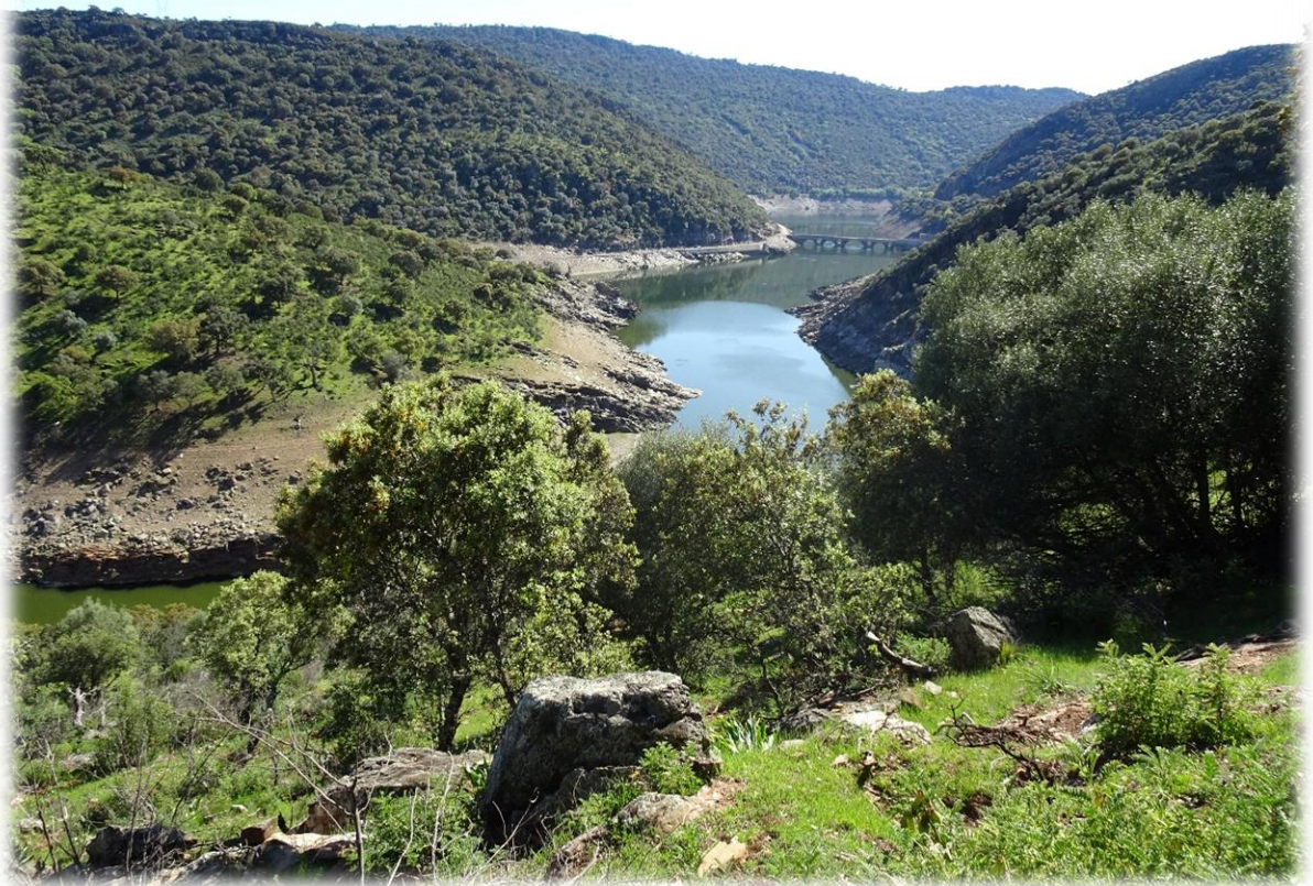
Af en toe krijgen we ook op deze wandeling een zicht op de Taag.