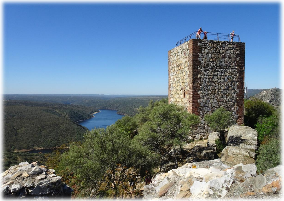
Vanop deze toren hebben we een 360° zicht over het volledige natuurpark Monfragüë.