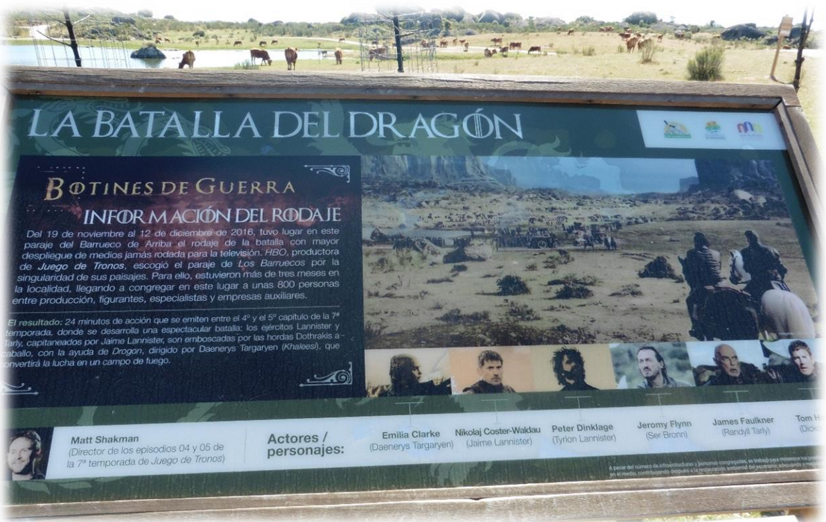
De Amerikaanse televisiezender en -producent HBO koos het prachtige Extremadura als decor voor scènes uit het zevende seizoen van Game of Thrones. Onder andere in Los