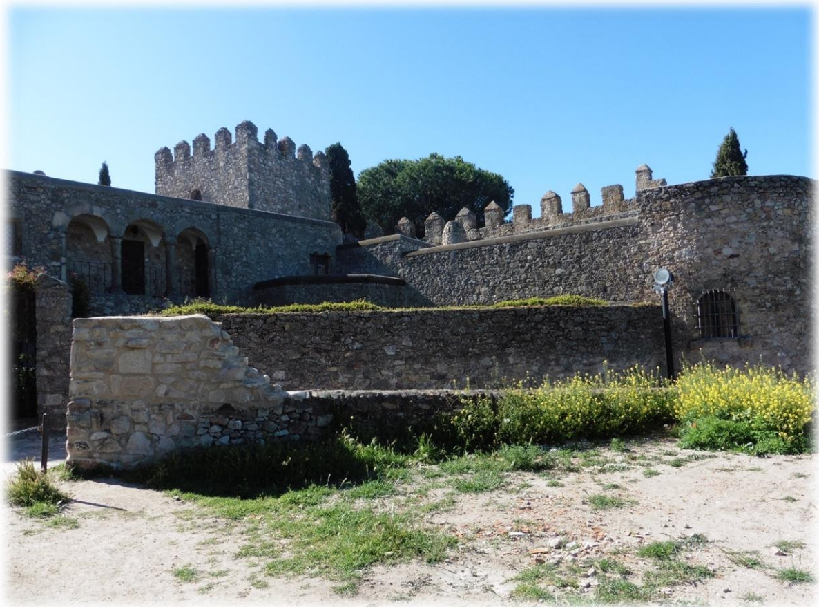
Alles in Trujillo ruikt naar de middeleeuwen, met als hoogtepunt het imposante Castillo de Trujillo. Het kasteel werd in de twaalfde eeuw gebouwd op de resten van een vroeger