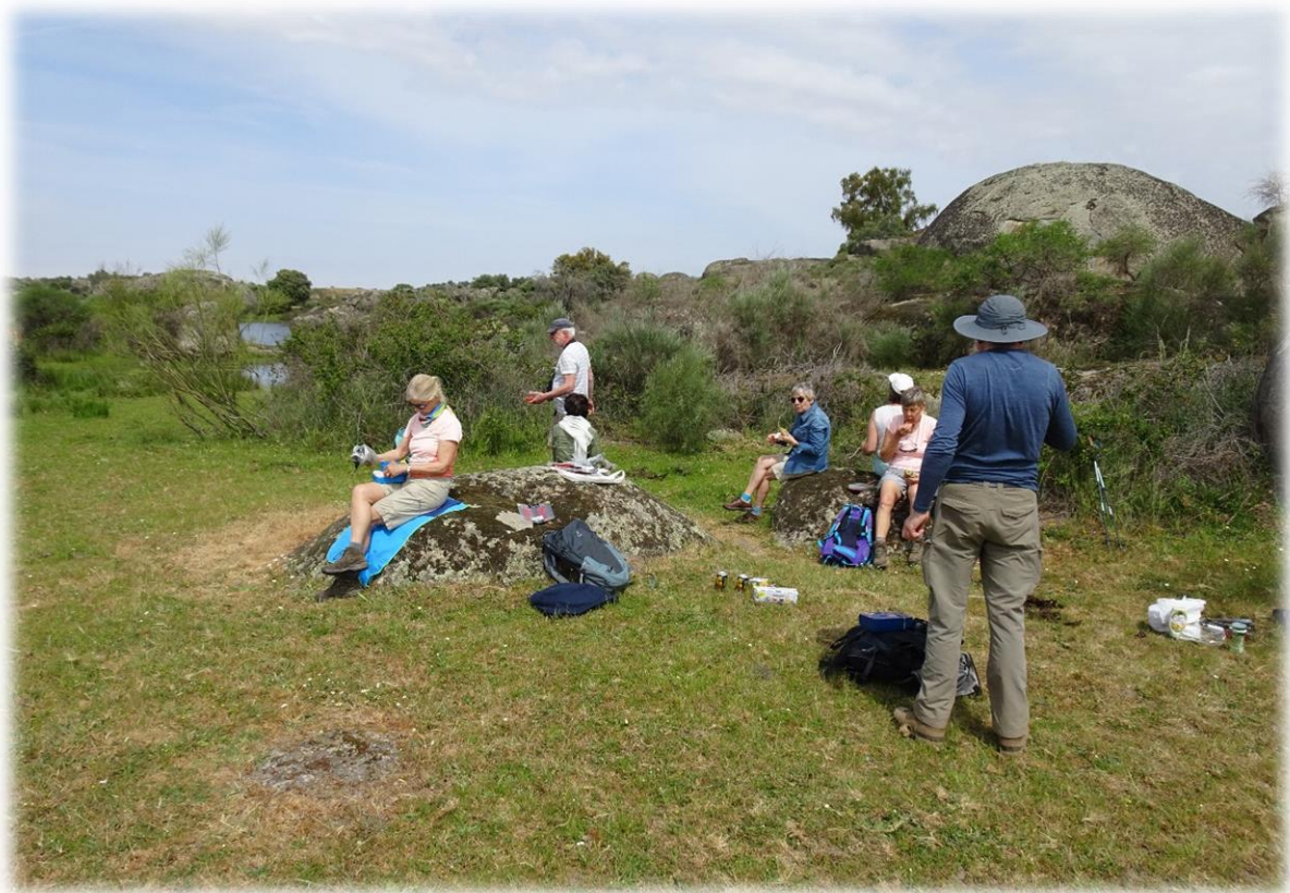
We nuttigen onze picknick op een mooi plekje.