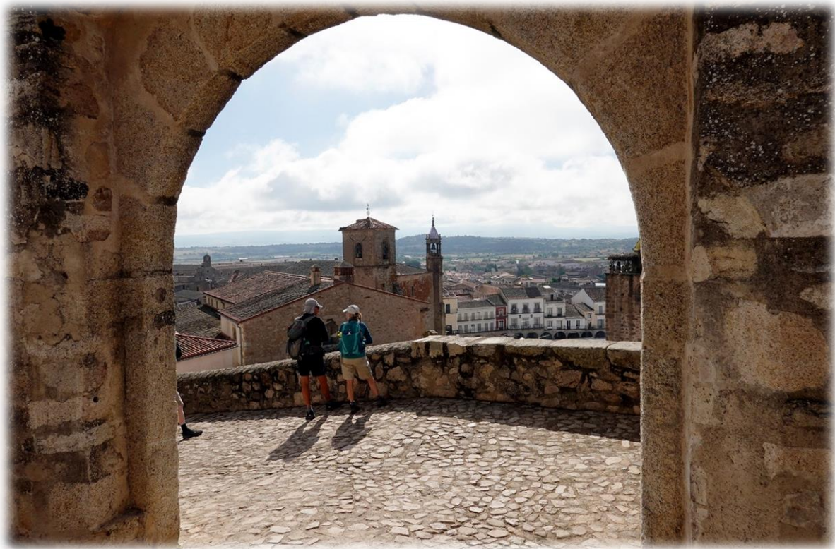
Op weg naar het kasteel hebben we een mooi uitzicht over de stad, zijn omgeving en over de ooievaarsnesten in de onmiddellijke buurt.