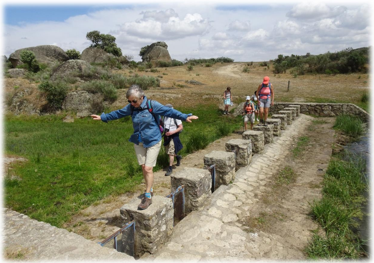
Een goed evenwicht hebben is altijd meegenomen.