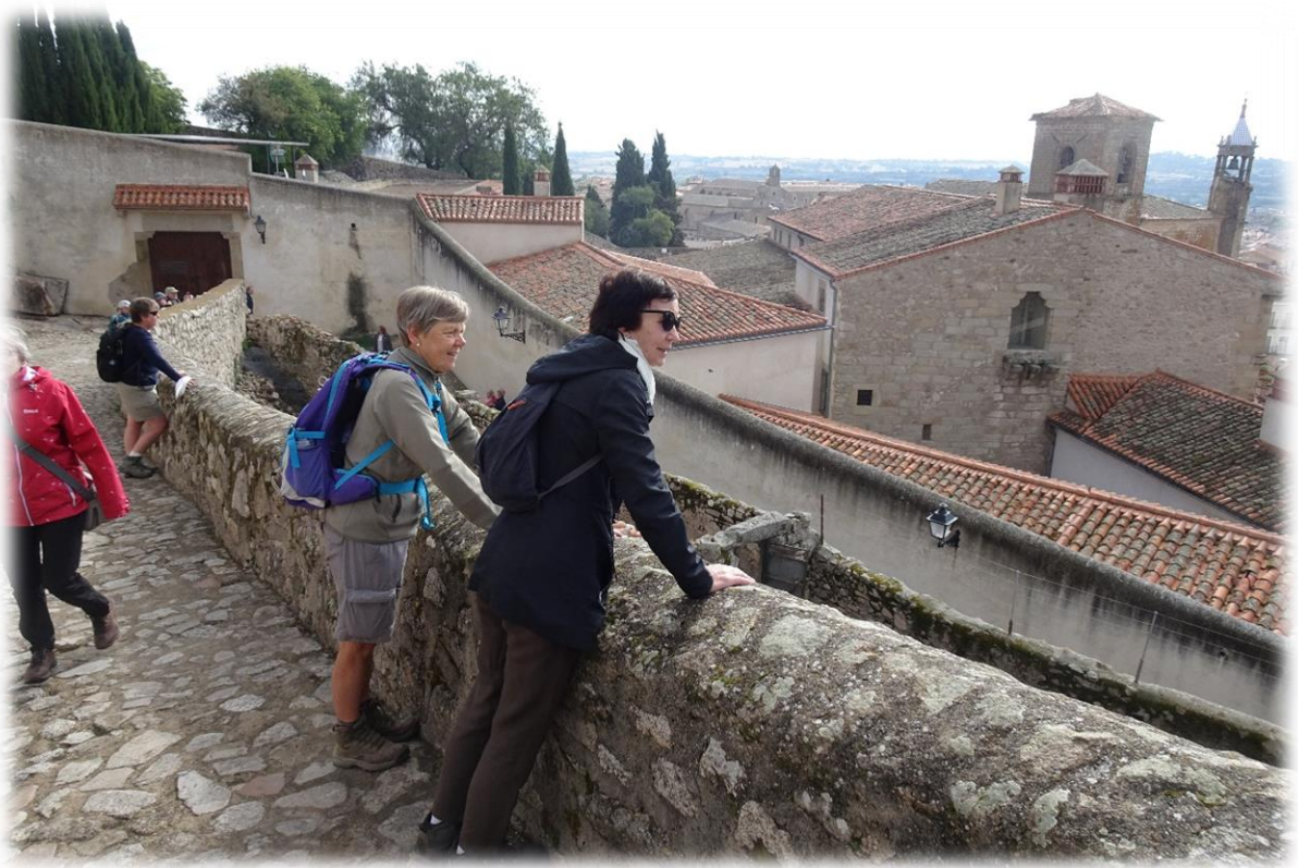
Francisco Pizarro (foto boven) werd geboren in de stad Trujillo in Extremadura op 12 mei 1468. Pizarro veroverde Peru in de eerste helft van de 16 de eeuw.