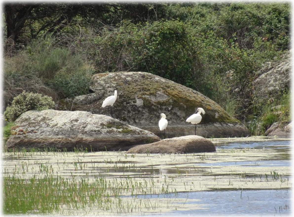
Enkele lepelaars rusten uit op een rots in het meer. Het is een grote witte vogel met een lepelvormige snavel.