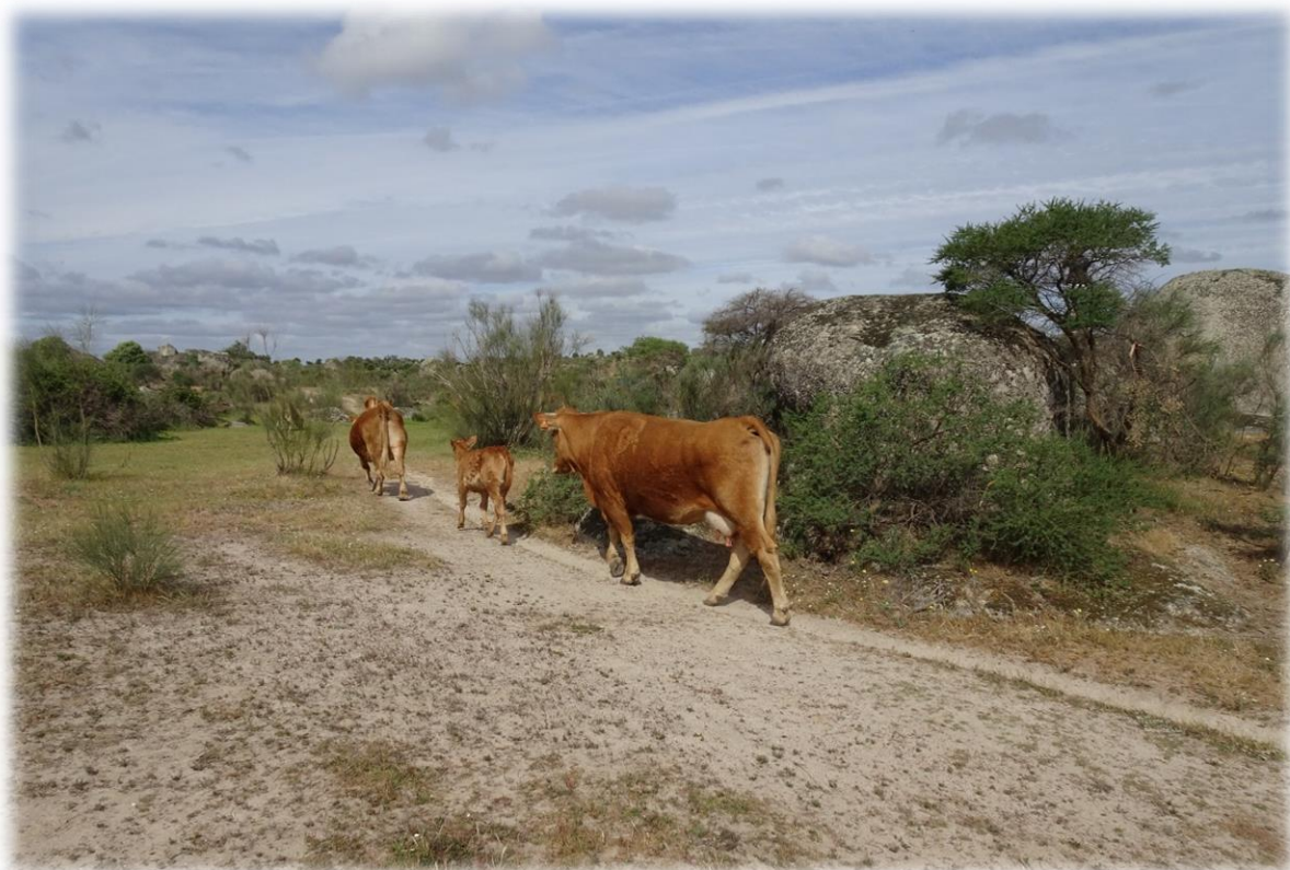
Koeien lopen hier vrij rond maar laten de wandelaars met rust.