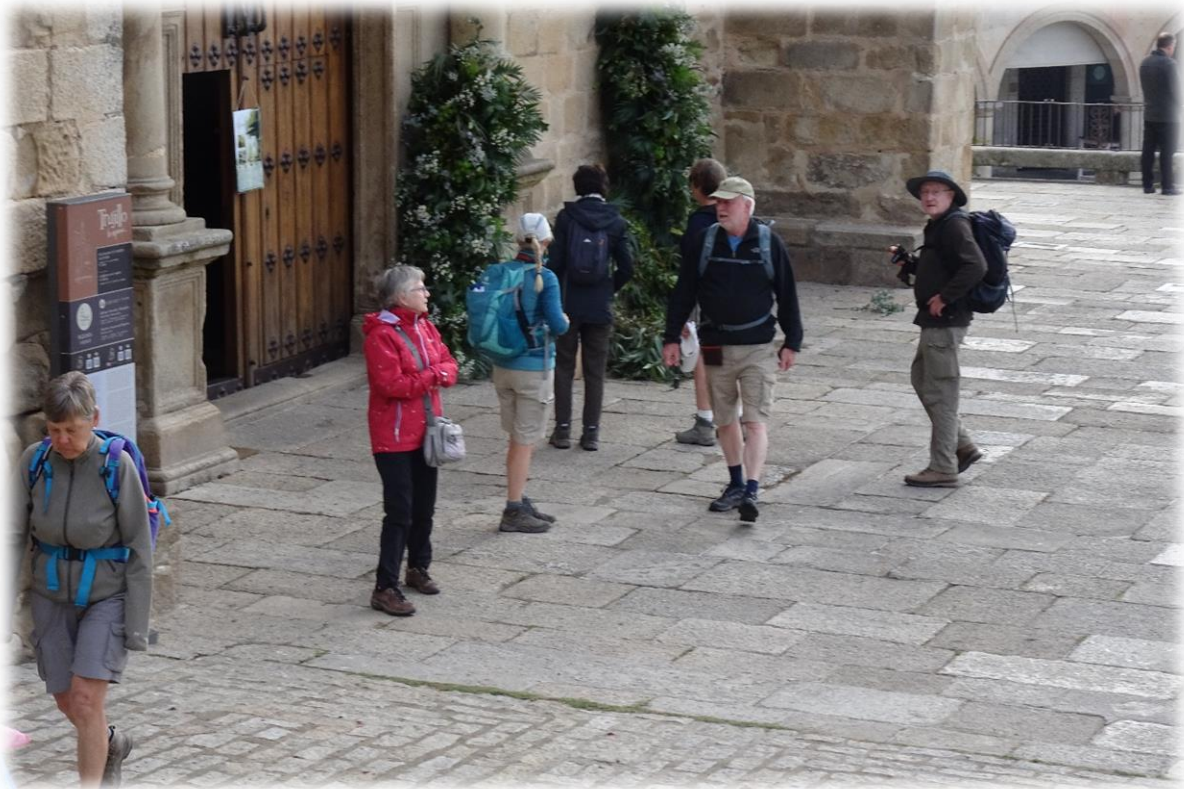
De hoofdkerk van de stad is open en toegankelijk maar sinds korte tijd dien je overal toegang te betalen.